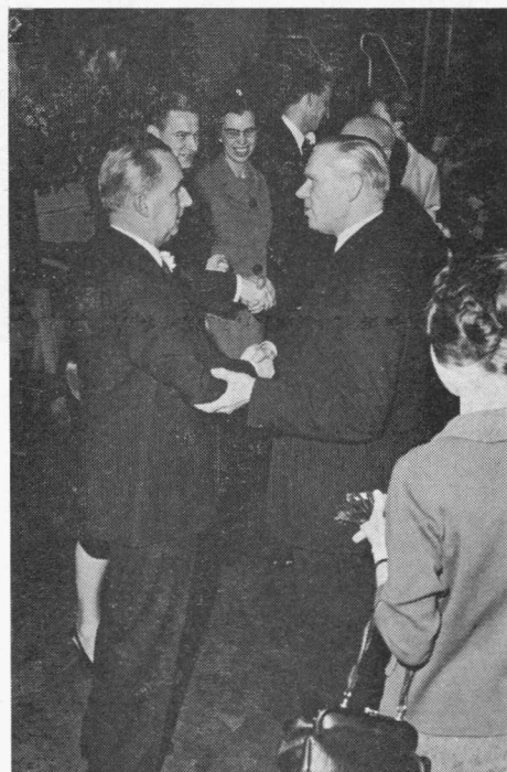
Ir. Zaaier feliciteert als een der eersten zijn collega.

De aanwezigen maakten toen van de gelegenheid gebruik de jubilaris en zijn familie te feliciteren, waarna toen de werktijd geëindigd was ook vele medewerkers uit het bedrijf zich in de rij van gelukwensenden schaalden.