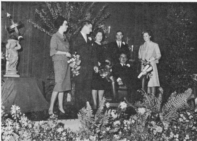
De geschenken vormden het decor voor deze familiefoto.

het moeilijk hebben. Hij is het middelpunt van zijn eigen gezin". De heer Zaaier eindigde zijn toespraak met het uitspreken van de wens dat de jubilaris nog vele jaren voor zijn gezin en voor de onderneming gespaard mag blijven en dat hij en zijn collega's opgewassen mogen zijn tegen de moeilijkheden die ongetwijfeld voor hen liggen. Namens de Raad van Bestuur bood hij een klok aan.